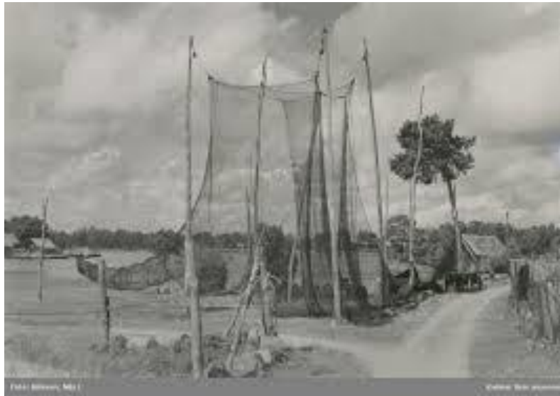
I galge upphängt bottengarn för torkning