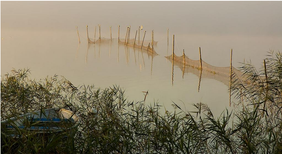
Bottengarn i Ringsjön vid Sätöfta