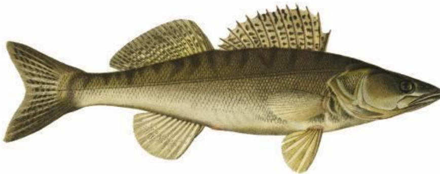
Gös (Sander lucioperca) målad av Wilhelm von Wright 1839

Styrelsen utser därefter exekutiv personal i verksamheten.